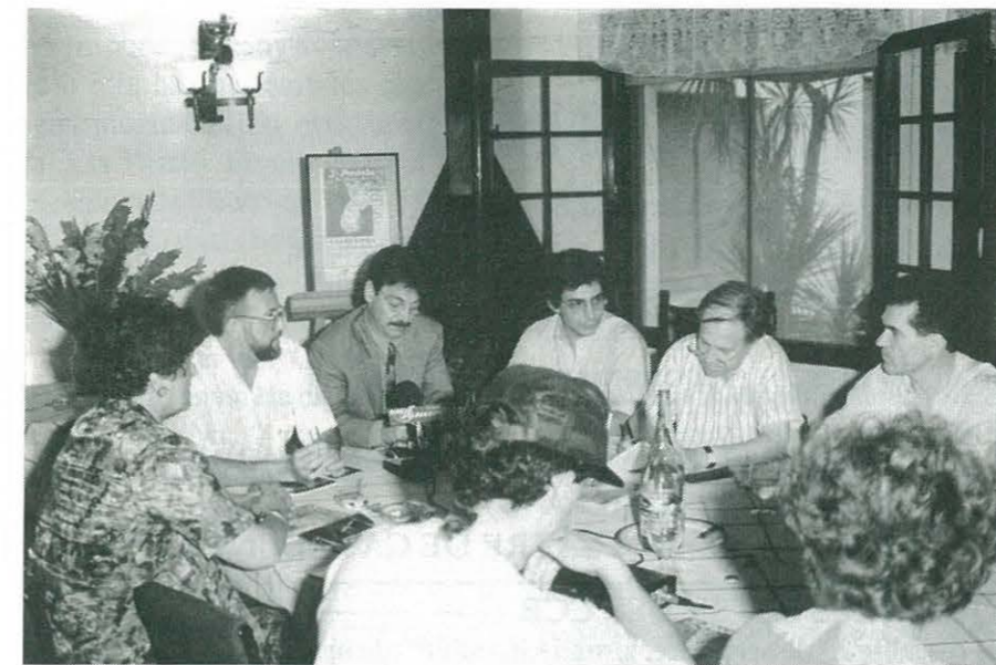
Presentació a la premsa del cartell anunciador de la 3a Trobada de Teatre Amateur

D'entre els espectacles que tindran lloc durant la trobada de teatre figuren per a la nit de dissabte