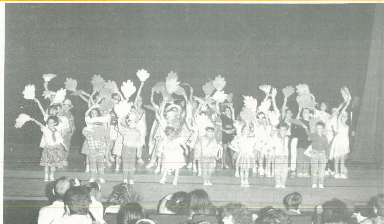
Festival Infantil 1993