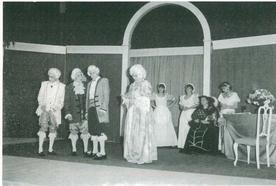
"Pel davant... i pel darrera" juntament amb "El Tartuf" obriran la trobada i les jornades de teatre d'Ulldecona.

ursos de teatre, la repercussió de la Societat d'Autors a l'hora d'estrenar un muntatge, la reflexió, no sensació, al voltant del teatre